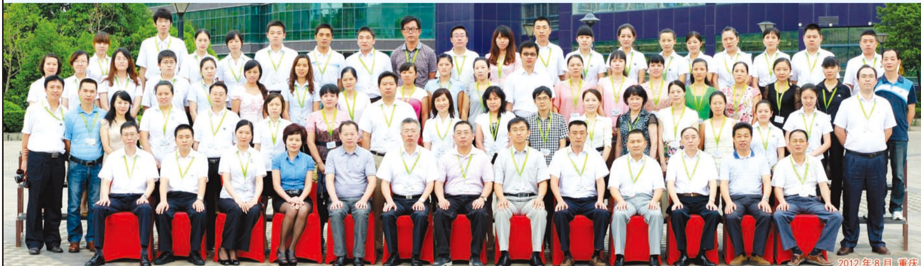
图注 中民燃气财务工作会议合影